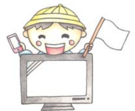
健康づくりキャラクター メディト君

皆さんの家庭では、食事中にテレビはついていませんか？ 子どもたちの身の回りには、メディアがあふれています。