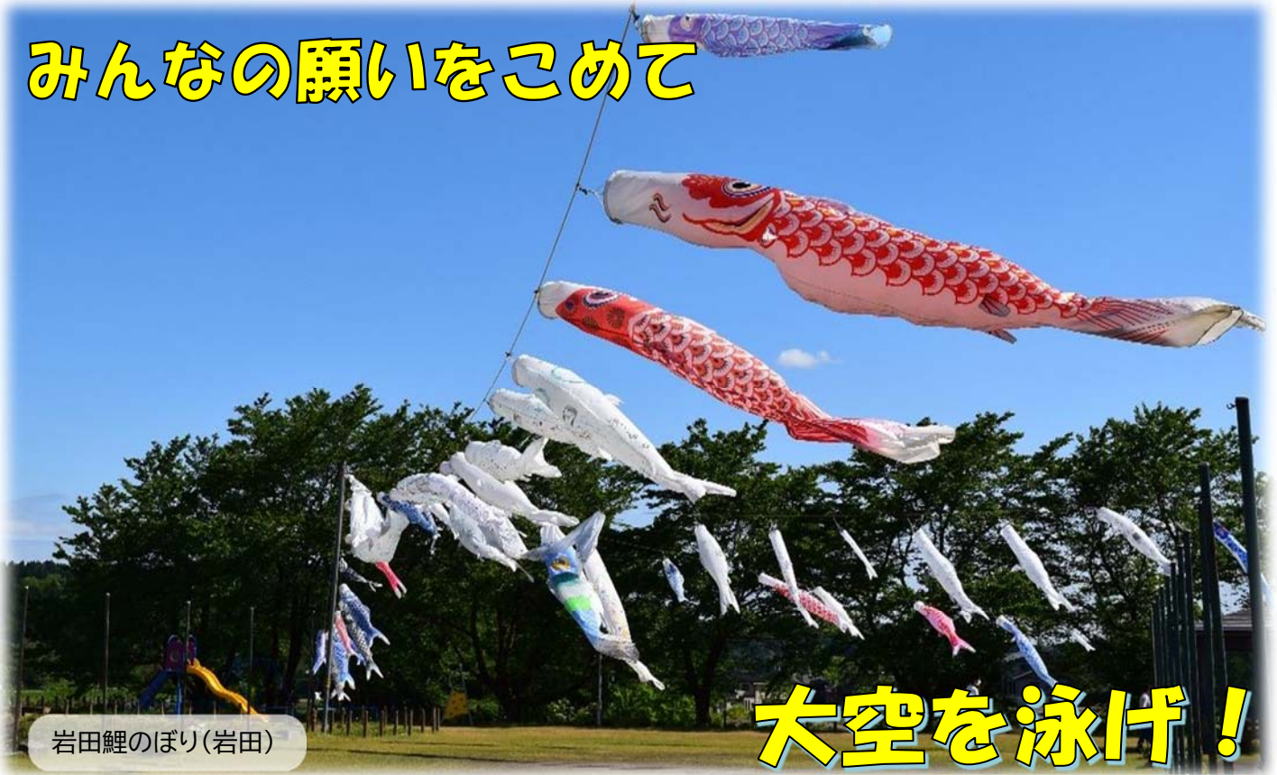
岩田鯉のぼり(岩田)