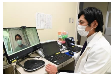
▲長岡中央総合病院側（イメージ）