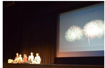
▲H30年度「平和劇」公演の様子