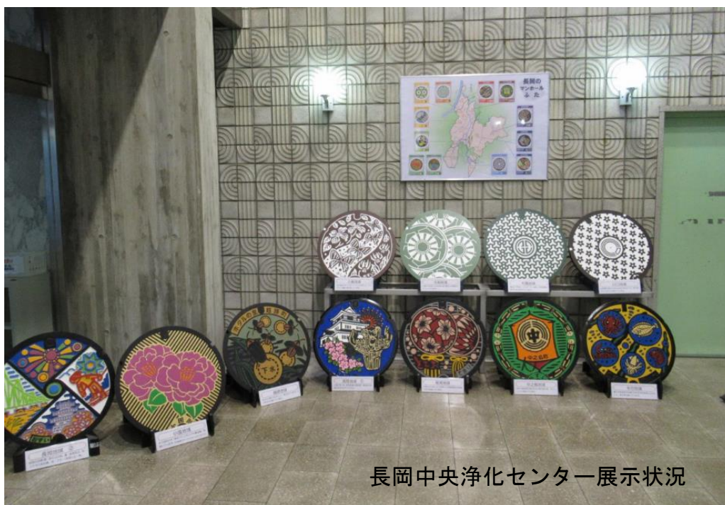
長岡中央浄化センター展示状況