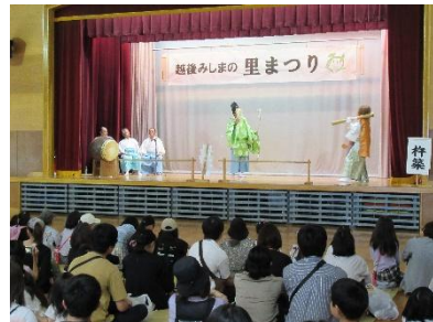
▲神楽舞演舞（昨年の様子）