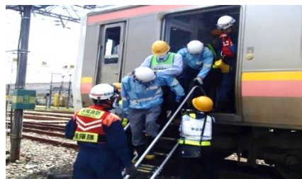
▲昨年の訓練の様子

※取材を希望される場合は、下記のQRコードから、JR東日本の企画総務部総務・広報・勤労ユニットへ事前にお申し込みください。