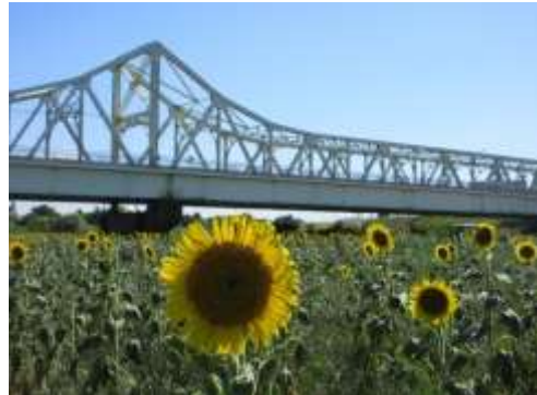
▲満開のイメージ（令和7年8月）