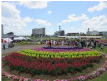
▲例年のイベントの様子