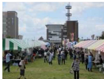
▲にぎわうイベントブースの様子