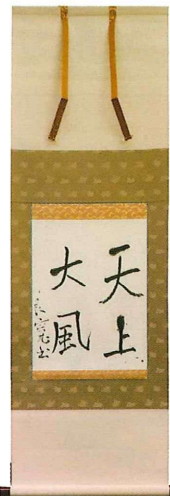
天上大風(良寛)複製