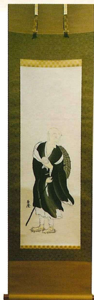
良寛和尚像(遍澄)複製

良寛の里美術館、燕市分水良寛史料館、良寛記念館では、相互の入場券半券の提示で 入館料100円引