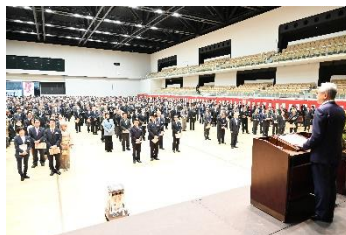
各界のトップが集まる市内最大の催し