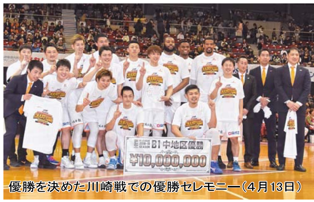
優勝を決めた川崎戦での優勝セレモニー(4月13日)