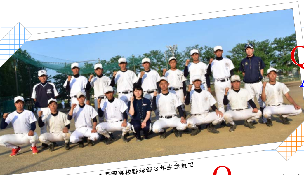
▲長岡高校野球部3年生全員で