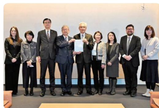
市長へ答申書提出