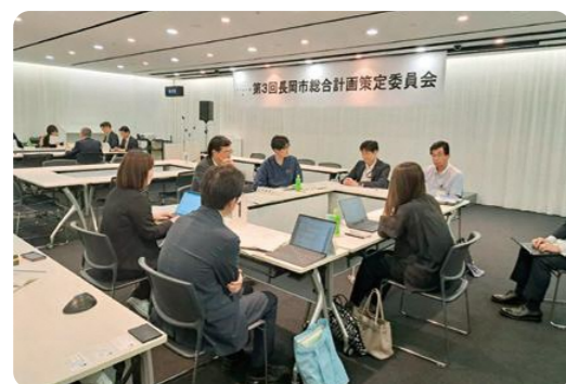
策定委員会でのグループ討議