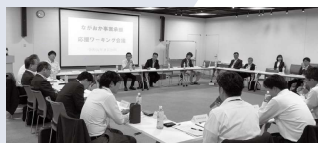
「ながおか事業承継応援フォーキング会議」

た、市内事業者から事業承継における実体験を取材した事業承継事例集の作成や、事業承継における税制優遇制度や補助金などの情報提供に取り組んでいます。国の事業承継補助金については情報提供に加え、申請書作成におけるサポートも行っています。さらに、今年度は新型コロナウイルス緊急経済対策の一環として長岡市事業承継・事業承継計画策定推進補助金を創設し、事業承継やBCP策定に向けた事業者の取り組みを支援しています。事業承継を進めるためには第三者への相談が非常に大切ですので、まずはお気軽にご相談ください。