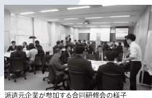
派遣企業が参加する合同研修会の様子

【経営後継者研修に関するお問い合わせ】 ※令和3年10月4日開講の第42期の受講生を募集中です。 中小企業大学東京校 企業研修課 Tel. 042-565-1207 E-mail: to-kenshu@smrj.go.jp