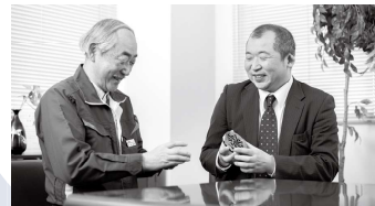
自社のハンドスピナーについて会長と構想を練る。長岡産業活性化協会NAZEが2月に開催した第2回全日本ハンドスピナー大会では、デザイン賞部門で優勝を飾った。

した。研修は10か月間泊り込みで集中的に行われ、自社の決算書を用いた財務分析を行うなど、経営者に必要なことを多く教わりました。また、研修には全国から若手の後継者が集まっていたため、活発な意見交換や悩みを相談を行うことができました。同期との繋がりは今でも貴重な財産となっていますが、何より大きかったのは後継者として会社を継ぐ覚悟ができたことです。研修を終えて帰った時、父へ自分からいつか替わりますかを尋ねたほどです。