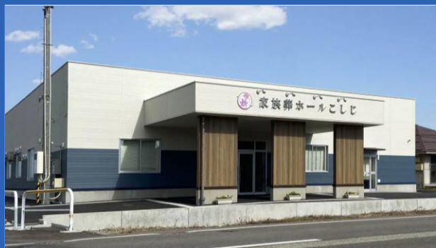
家族葬ホールこしじ