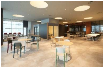
イノベーションサロン