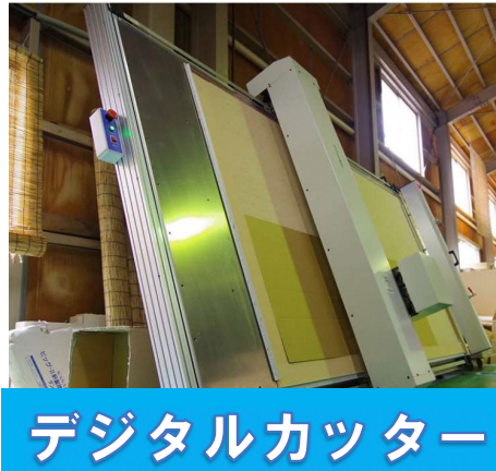
デジタルカッター