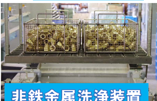
非鉄金属洗淨装置