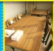
小千谷サテライトの出張相談室