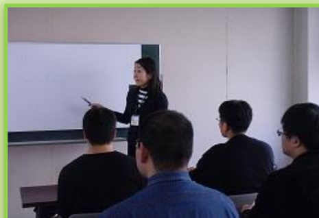
講習室での学習風景