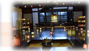
Tochio no Akari

For further information: Regional Promotion-Citizens' Affairs and Service Division Kawaguchi District Branch Office Phone: 0258-89-3113