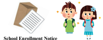
School Enrollment Notice

For detailed information: School Affairs Division Phone: 0258-39-2239