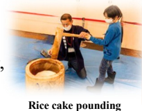
Rice cake pounding

For further information: Nagaoka City International Affairs Center, Chikyû Hiroba Phone: 0258-39-2714