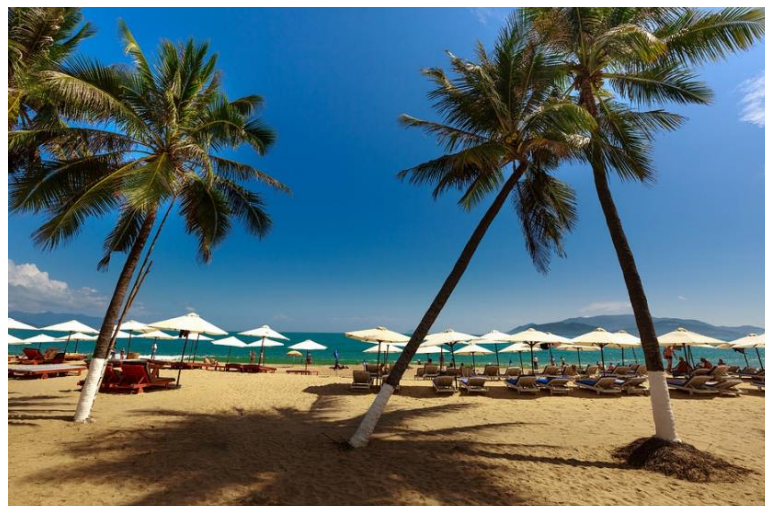
ニャチャンのビーチ