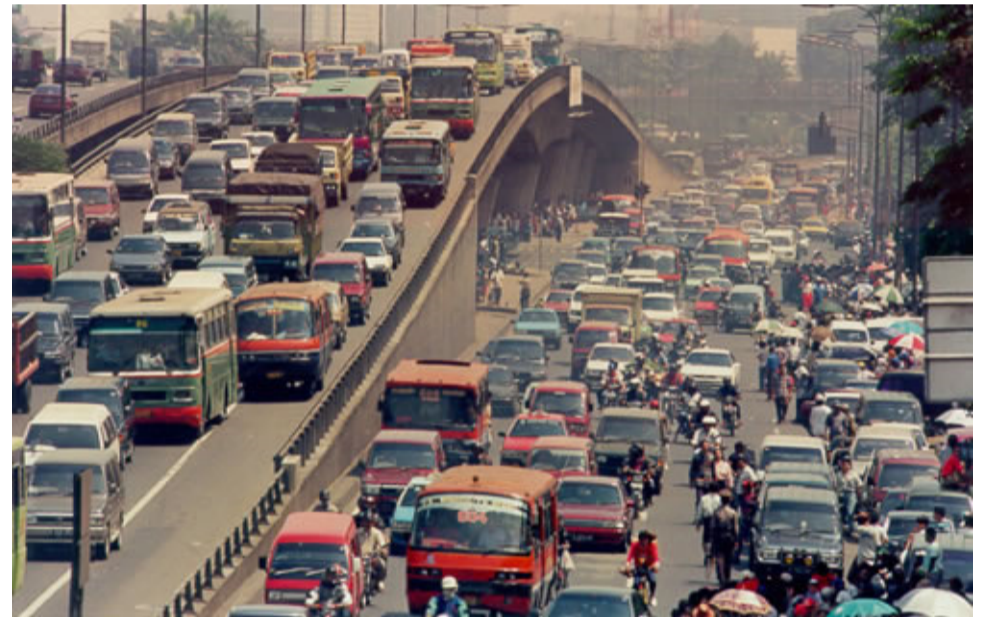
ジャカルタの交通の様子

A：私 わたし も静 しず かな街 まち と思 おも います。長岡 ながおか と（イン ドネシア）では交通 こうつう が違 ちが います。車 くるま は（長岡 ながおか で）気 き を付 つ けたほうがいい（こと こと があります） でも、私 わたし の街 まち は交通 こうつう ルールがあまり厳 きび しくな いので、た た くさ さ ん事 じ 故 こ が ありま ま す。