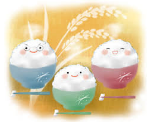
インドネシアのモチ