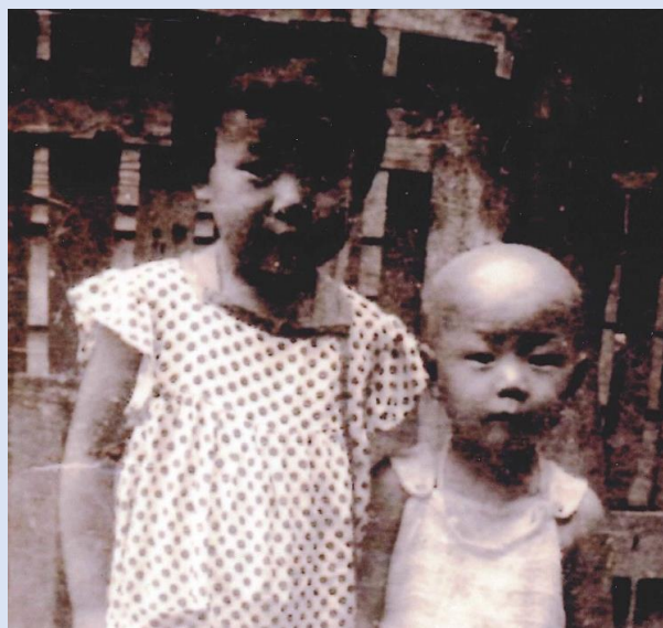
長岡空襲殉難者の男の子(写真右)