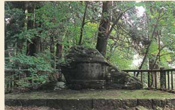
▲病翁碑(悠久山・蒼柴神社)