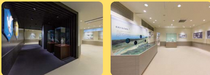
トキの標本ギャラリーや展示コーナーなど、子どもから大人までトキと自然環境について楽しく学ぶことができます。

トキ分散飼育が始まったことをきっかけに、トキを通じ自然環境について考える学習の場として開設しました。本物のトキの羽根に触れたり、標本などの展示コーナーで楽しく学ぶことができます。