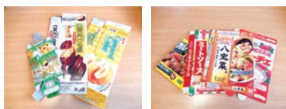
お菓子・食品の紙箱