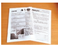
学校や市役所などからのプリント類