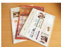
カタログ パンフレット