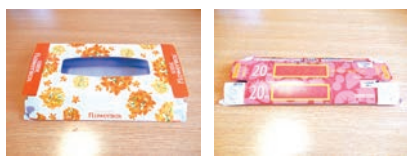
ティッシュペーパー・ラップの紙箱