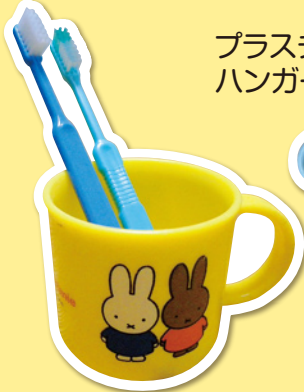
プラスチック製の コップ、ハブラシ