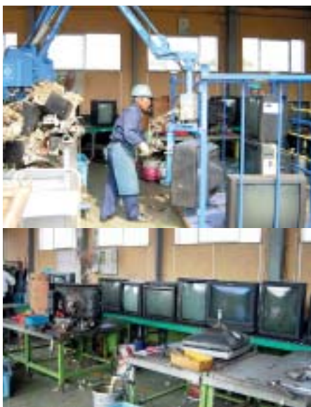
テレビを分解しているところ (株)豊和商事

「私どもへは、市町村、電器店、個人等から家電4品目が持ち込まれます。そして、例えばテレビはブラウン管とプリント配線基盤を取り外し、破砕後、再利用できる鉄、アルミ、銅、ガラス等に分別しリサイクルしています。また、持ち込む際に必ず貼付していただいている家電リサイクル券の番号は、毎日、国に報告しています。これによりご自分の出した廃家電が確実にリサイクルされているかを、家電リサイクルセンターのホームページ( http://www.rkcaeha.or.jp )で確認することができます。」 「このように、施行後の廃家電の引き取りは順調で、国の調べによると、21万トンもの材料がリサイクルされています。」