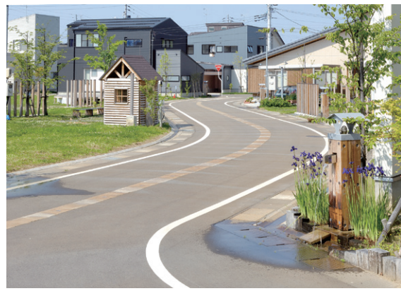
リプチの森撰田屋5丁目地区