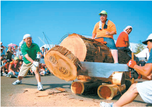
全国から力自慢が集まる