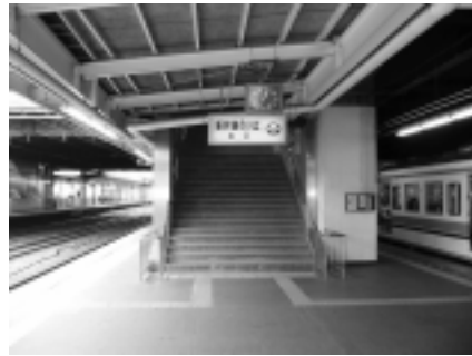
在来線ホーム階段

ホームまではエレベーターではなくリフトによる昇降となる。なお、別経路で業務用エレベーターが利用できる。