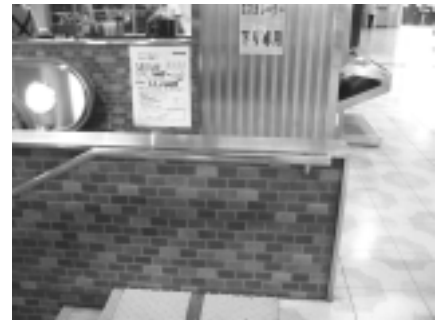
改札外の階段の手すり

誘導サインが設置されているが、途中に売店があるため、券売機から改札の見通しが悪い。