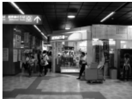
券売機からの見通し

幅員 80cm のため、車いす使用者の操作する手が改札に当たることが懸念される。