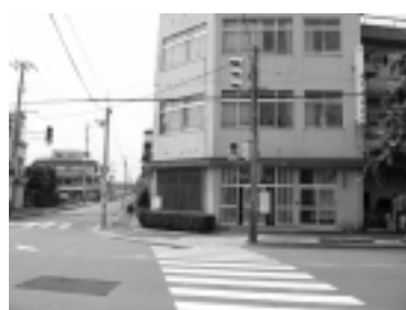
音響装置のない信号機

また移動経路にある標識、標示等についても、反射材料を用いるなど基準にあわせた整備が必要です。