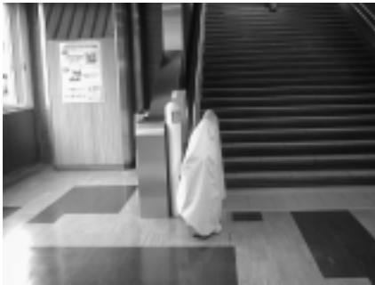
新幹線ホーム階段の昇降機

ホームまではエレベーターではなくリフトによる昇降となる。なお、別経路で業務用エレベーターが利用できる。