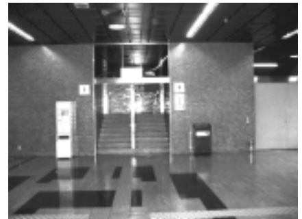
新幹線改札内のトイレ