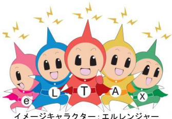
イメージキャラクター：エルレンジャー

お問い合わせ先 〒940-8501 新潟県長岡市大手通1丁目4番地10 シティホールプラザ「アオーレ長岡」東棟 長岡市財務部市民税課 市民税第一係 特別徴収担当 電話：(0258) 39-2711 FAX：(0258) 39-2263