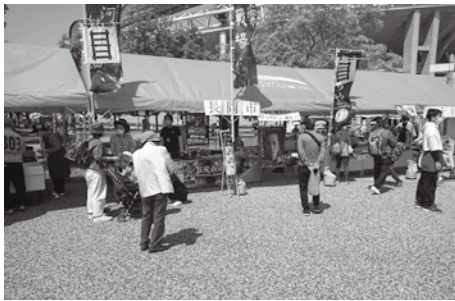
各地域がブースを出展