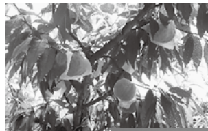
刈羽村の砂丘桃 や栃尾の油揚げ が購入可能!