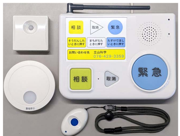
【固定電話回線使用タイプ】