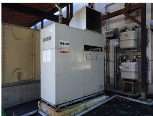
写真:ガスコージェネ