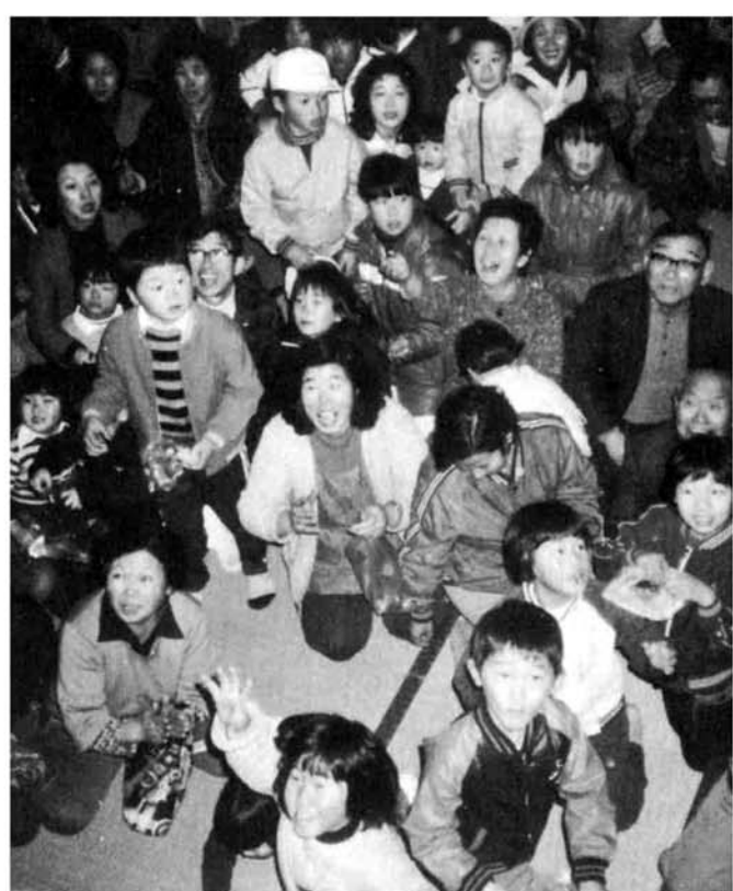
▲こつちの方にもまいて〜