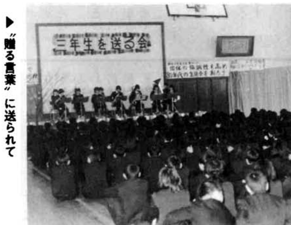
▶贈る言葉に送られて