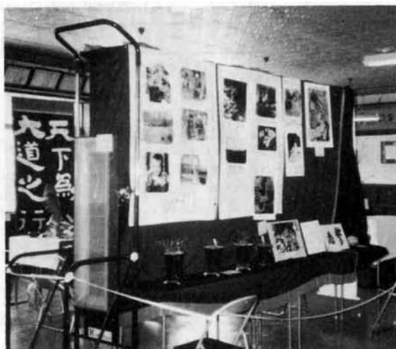
▲自慢の作品ばかり

与板警察署員とその家族の皆さんの作品展が、2月7日〜11日まで警察署の2階で開かれました。以前は毎年このような作品展はやっていたのですが、近年いろいろな事件等に追われなかなか開けず、今回は5年ぶりだそうです。常日頃の忙しい勤務にもかかわらず、全署員と家族の皆さんのりっぱな作品が約100点展示されました。