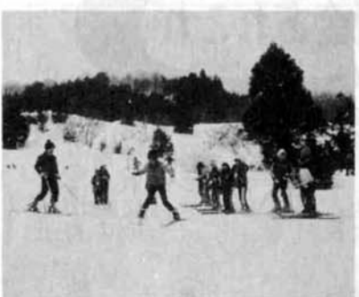
▶小学校のスキー授業

堤下の裏手にある ぼうず山の立ヶ入ス キー場は、この冬最 高の人気を呼んでい ます。