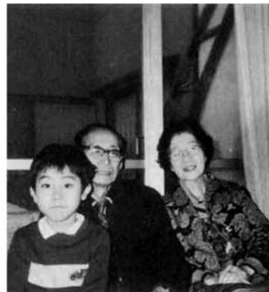
博吉くんと おじいちゃんとおばあちゃん

勤労青少年ホームでは、四月より、料理、茶道等の講座を予定しています。あなたもホーム利用者になってみませんか？ くわしい事はホーム(二〇一五)迄お問い合わせ下さい。