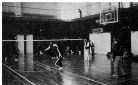
▶助け合いの精神で 今年はずいぶんこの班が 優勝を〜と、横原町内で第