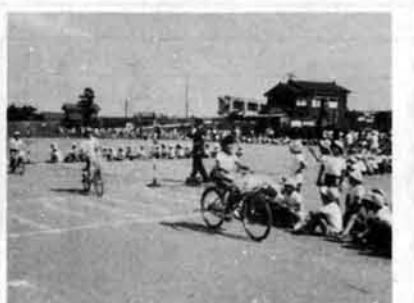
▲昨年行なわれた自転車教室

新学期まであとわずか。新入学児童をお持ちのご家庭では、期待に胸をふくらませながら入学の準備になにかとお忙しいことでしょう。