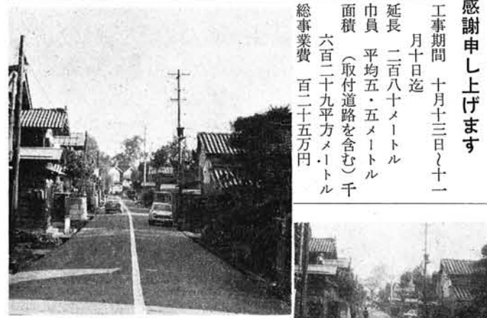
写真上は完成後 右は完成前