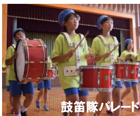
鼓笛隊パレード・ブラスバンドパレード