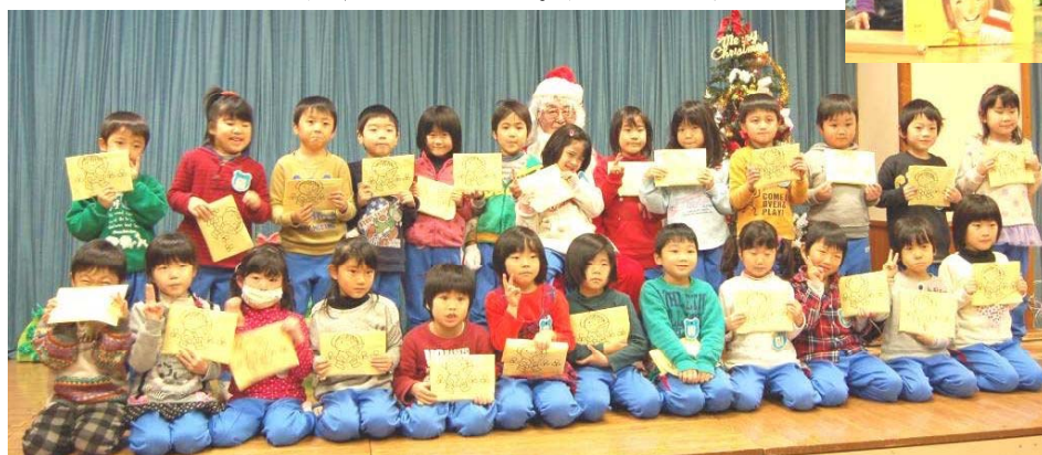
←サンタと記念撮影(年長児)