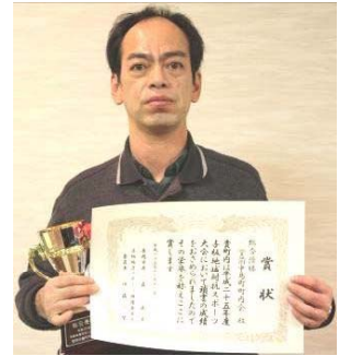
↑ 総合優勝 堂前中島町