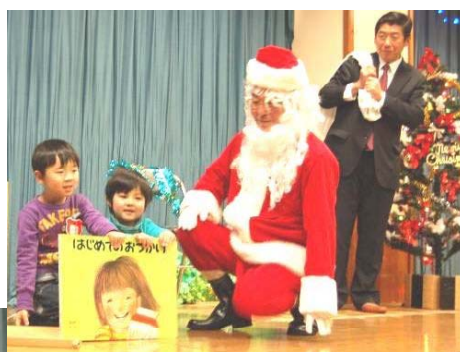
↑新しい大きな絵本に園児もにっこり

たくさんのプレゼントを手に与板ライオンズクラブの皆さんが、与板幼稚園を訪れました。大きな絵本と園児61名にクリスマスプレゼントを贈りました。園児は「お友達と仲良くしようね」など、サンタクロースといくつかの約束をしていました。(12月20日)