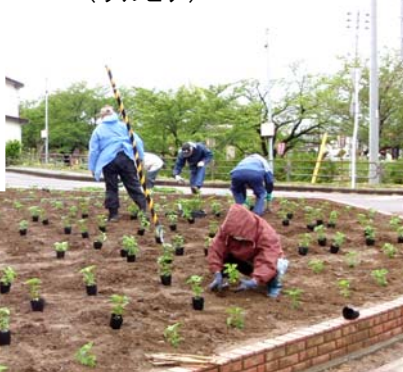
▼ 地域内 10ヶ所の街路花壇 (サルビア)