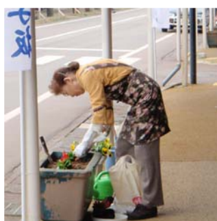
◀ 商店街のフラワーボックス (ペゴニア)

与板小学校 5 年生が総合学習で、ごろ押しと田植えを体験。水田農業推進協会の方々からコツを教わると、みるみる上達。おそろいの泥のくつ下を履いた児童達が、秋の豊作を願いました。(5月18日)