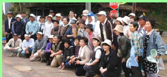
▲23名、全員が首都圏からの参加

—「都市住民が、農家などに宿泊して農作業をし、その地域の歴史や自然に親しむ余暇活動のこと。」馬越町内の取り組みをご紹介します。