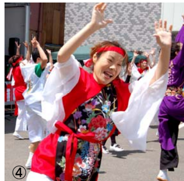
【写真】①かわいいお客さん ②体験コーナー ③フリーマーケット ④芸能発表