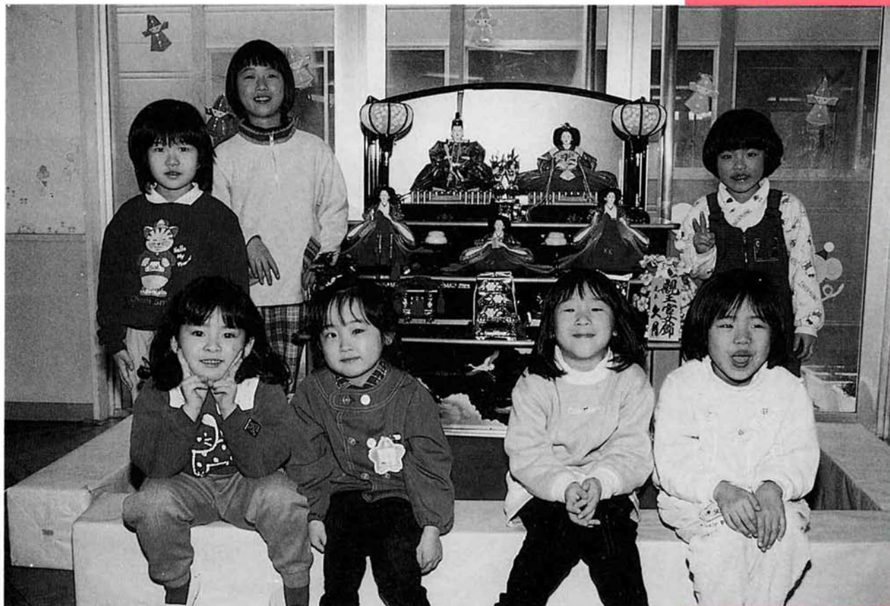
3月3日はひなまつり。園児が大好きなおひなさまと一緒にハイチーズ。(与板保育園にて)