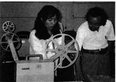
16ミリ映写機操作講習会

【夏休み子ども映写会】 ◆期間：7/24～7/31 ◆主催：与板町防犯組合 与板町交通安全母の会 ◆内容：ジャングル大帝一親友一他 ◆観客総数：515名