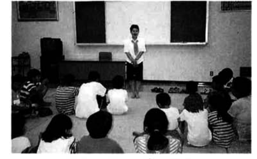
与板町交通安全母の会