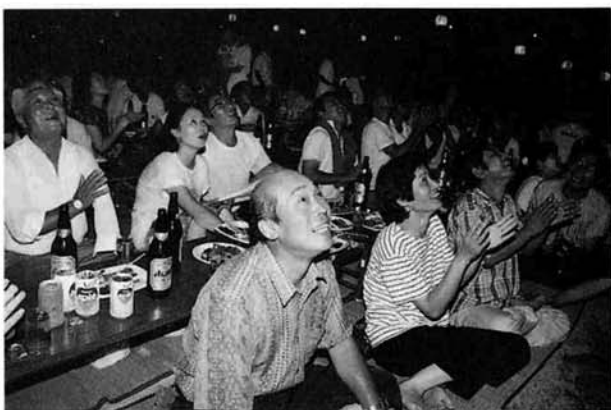
サマーフェスティバル（榎原）

また、この日のメインイベントは何と言っても大花火の競演。与板町で本格的に上がるのは31年ぶりとかで、スターメインやナイアガラなど、夏の夜を彩る53発の花火がアナウンス付きで打ち上げられると、会場から盛んな拍手と歓声が沸き上がっていました。