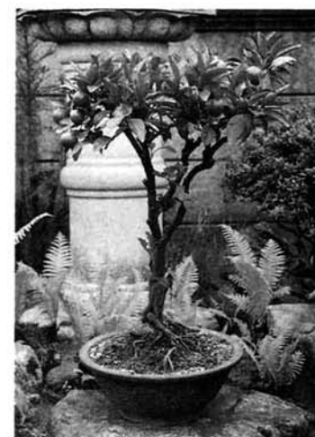
蜜 柑 樹齢 40年以上 安達五三郎(長丁)