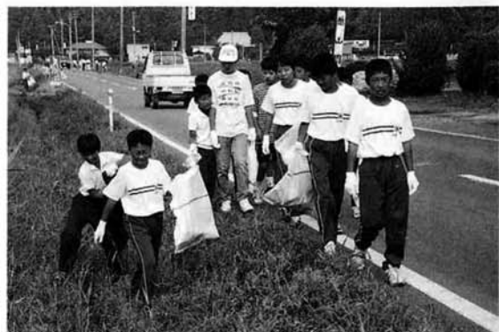
例年、町ぐるみで取り組んでいるクリーン奉仕活動 今年も8月26日に行われた

てくることでしょうか。 今後は、町社会福祉協議会が窓口になって、ボランティア団体の連絡調整や、個人的に申し込みのあった人の登録制を取って、ボランティアを希望する人へ紹介をするなどの業務を行うことにしています。 これから超高齢化社会へと進むにつれて、共に支え合う福祉の町づくりをめざすためには、皆さんの積極的な参加がぜひ必要になってきます。「こんなボランティアもあります」といった情報や、個人的にボランティアをやってみたくてという方は、町社会福祉協議会まで一声かけてください。 ボランティアがこれだけ注目されるのは、ただ単に誰かに何かを「してあげる」一方向的なものではなく、その活動を通して「生きる希望や喜びを分かち合える」という充実感があるからではないでしょうか。そしてまた、ボランティア活動は「自己を表現」して、「自己を再発見」できる場でもあります。 相手の喜びを自分の喜びとして受け止めながら、共に支え合い高め合う。こんなに温かく、素晴らしいボランティア活動に、ちよつとだけ触れてみませんか。 あなたにもできること、きっと何かあるはずですよ。