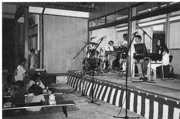
鳳仙花コンサート（堤下）