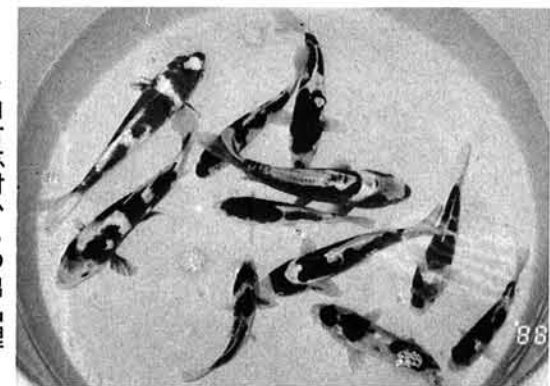
▲山古志村からの出品鯉

一月二十三日(土)と二十四日(日)に、東京・平和島で行われた「第二十回全日本錦鯉品評会」に、山古志村から四十点以上が出品されました。このうち入賞したものは、優勝二点を含み十五点でした。