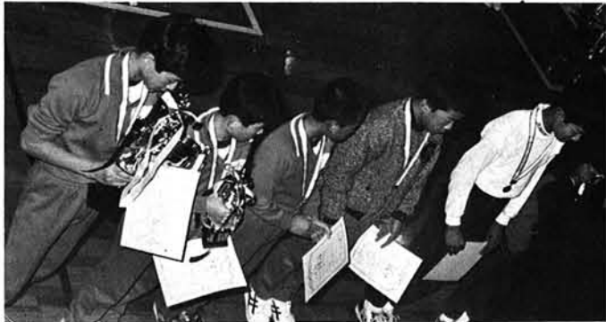
▲表彰を受ける選手たち