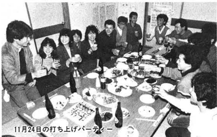
11月24日の打ち上げパーティー

十一月二十日、村連合青年会の主催で「親父と嫁さん」の公演が催されました。公演は五百六十五人が観て好評でした。青年会の活躍にも拍手が贈られました。