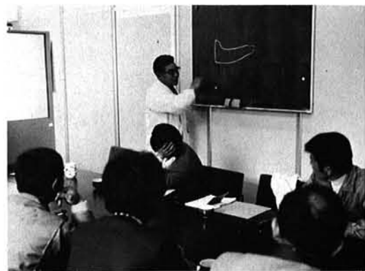
熱心に研修する組合員

青年農業後継者で組織している、村の畜産業の主軸肥育牛生産組合が去る五月二十日東京芝浦の枝肉市場で現地視察を行いました。