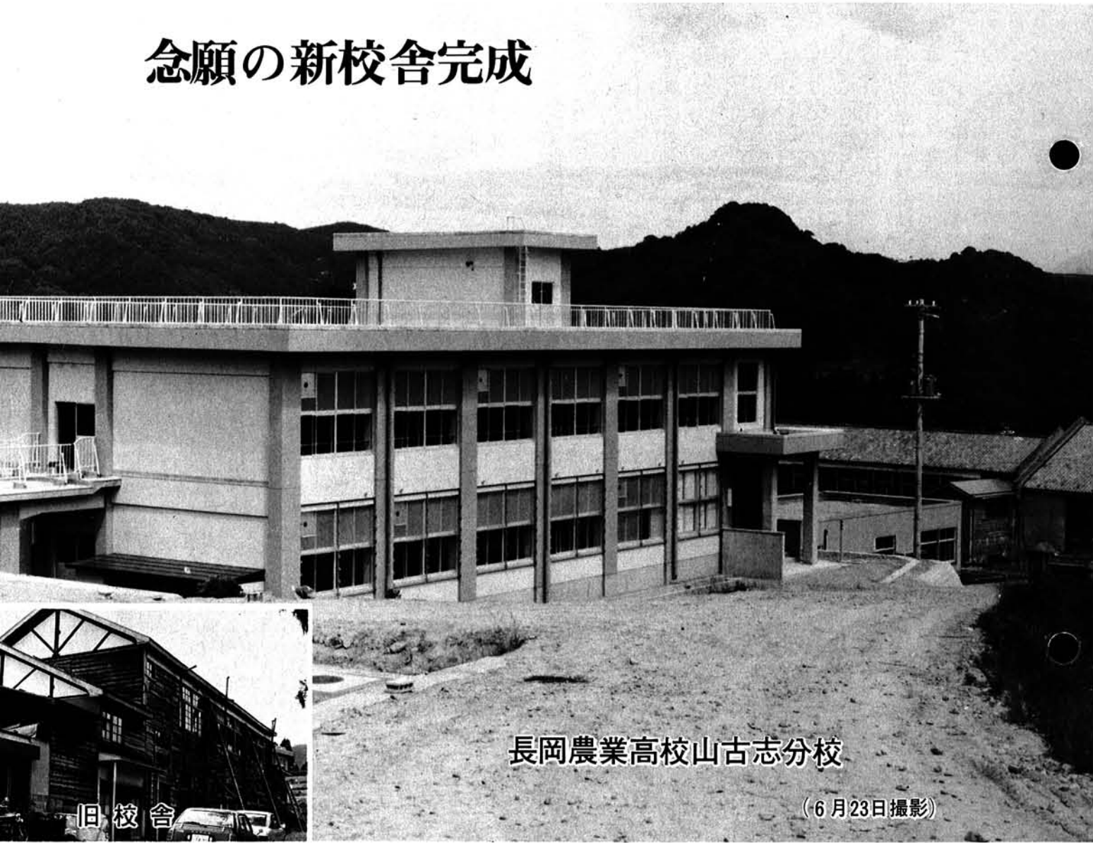
長岡農業高校山古志分校