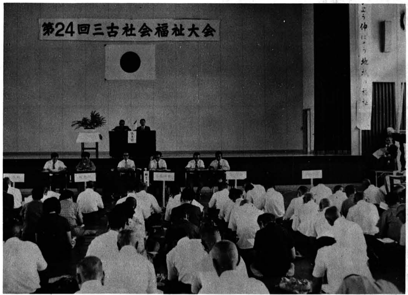
約300人の関係者が集まり、盛会に行われた三古社会福祉大会 7月26日山古志中学校において