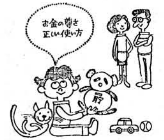
金銭教育はこどものうちに

最近、石油問題を契機に物を大切にしようとか節約しようとかと、節約時代がやってきたようです。このような時にこのたび梶木小学校の生徒会貯金組合が郵政省貯金局長から次のような賞状と記念品が贈られて児童たちは感激しております。