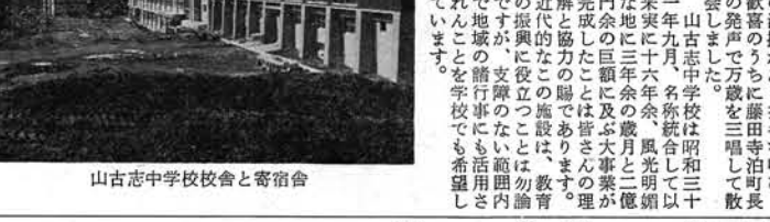
山古志中学校校舎と寄宿舎

待望久しかった山古志中学校建設工事の竣工式は、十一月二十三日午前十一時から、山古志中学校建設工事現場にて盛大に行われました。