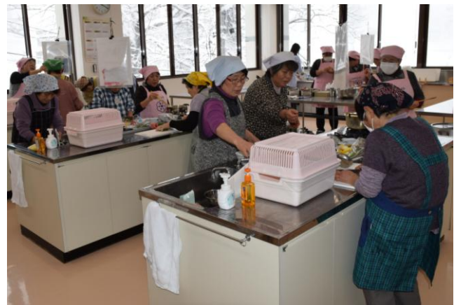
▲種苧原集落（なごみ苑にて）