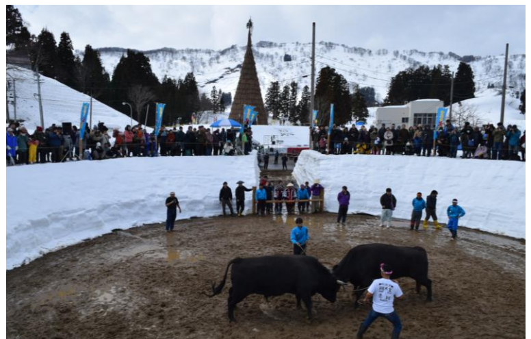
▲ 昨年の雪中角突きの様子

※イベント内容は、天候等の理由により、内容及び時間が変更又は中止になる場合があります。