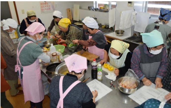
▲虫亀集落（虫亀集落センターにて）

山古志地域食生活改善推進委員主催の健康料理教室が、2月7日・8日に行われました。2日間で30名の参加があり、地域の先生（食生活改善推進委員）の指導を受けながら、減塩メニューの鶏肉のアップルジンジャーソースやカレーもやし、野菜の揚げびたしなどの調理と試食を行い、午後からは軽体操を実施しました。おしゃべりと笑いの絶えない楽しいひと時を過ごしていました。