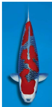
国魚賞・第50部 五色 かの養鯉場（虫亀）

また第2展示会場内では、長岡市（山古志）の観光PRも行い、山古志の魅力を発信できました。