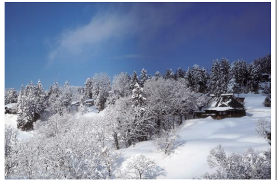
▲推薦・長岡市長賞