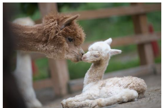
▲モバイル部門山古志観光協会賞