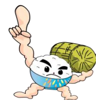
長岡うまい米キャラクタ ー「まんまくん」

●申込先 8月31日(水)までに参加申込用紙を産業建設課まで提出(用紙は産業建設課または長岡市ホームページからダウンロードできます。)