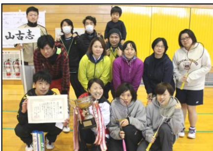
●バドミントン 毎週月、水、金 19:30～21:45

活動サークル及び活動日等は下記のとおりです。問合せは総合型クラブY-GETS (☎ 59-3070) まで