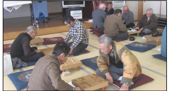
▲白熱した対局の様子