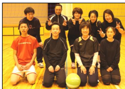
●ソフトバレー 毎週水、金 19:30～21:45