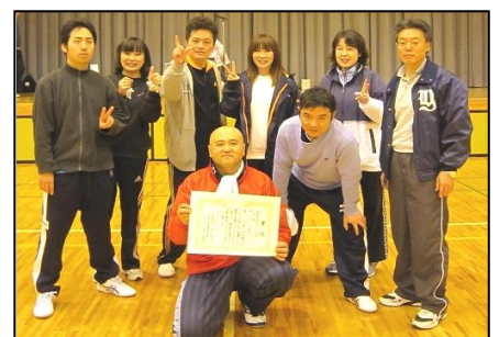
●卓球 毎週火、水、木 19:30～21:45

3月はシートベルト・チャイルドシート着用強調月間 命を守るため、全ての座席でシートベルトの着用とチャイルドシートを使用しましょう!!