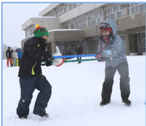
▲ボール運びリレーの様子