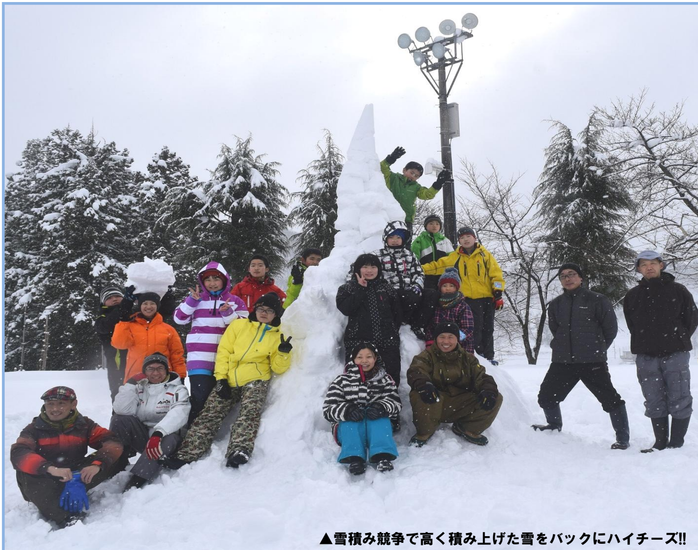
▲雪積み競争で高く積み上げた雪をバックにハイチーズ!!